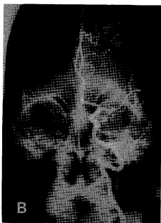
Fig. 2 Transfemoral cerebral angiogram in the same patient(case 1) : A) Complete obstruction of right MCA stem on lateral view, B) Partial obstruction of the left MCA at its proximal portion(2 years after the left side film).

거액상 25년전 버거씨 병으로 교감신경 절제술 및 양측 슬허부 절단술(Below knee amputation) 시행하였고, 4년전부터는 재발되는 흉통으로 버거씨 병의 관상동맥 침범으로 진단받고 칼슘 길항제 복용중이었다. 과거 30여년간 하루 2갑 정도의 담배를 피워왔다. 신경학적 검사상 의식은 명료하였고, 얼굴을 포함하여 우측 반신에 팔각 및 온도각 감소와 운동마비를 보였다. 검사실 소견은 정상이었으며 뇌전산화 당층 촬영상 우측 기저핵 부위에 저음영 소견을 보였다. 복부동맥을 호소하여 시행한 복부 전산화 당층촬영에서 복부 대동맥류 소견을 보였다.